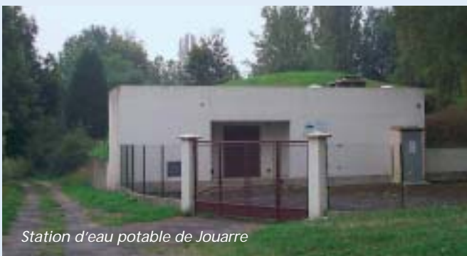
Station d'eau potable de Jouarre

C'est ce qu'une charte de « bonne conduite », signée entre la communauté de communes et ses partenaires, formalisera afin que ces « Journées de l'eau » soient le point de départ d'un engagement concret sur le long terme.