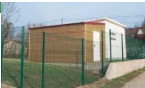
Station de pompage de Caumont (Sainte-Aulde).