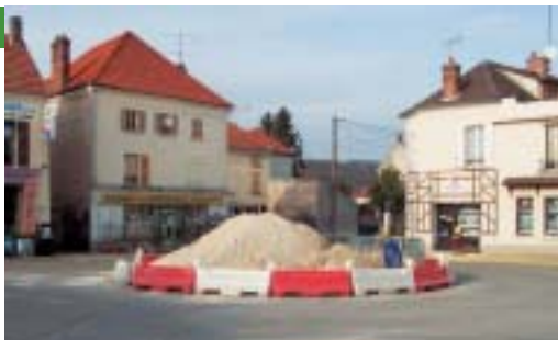
Les travaux ont déjà commencé à Saâcy...