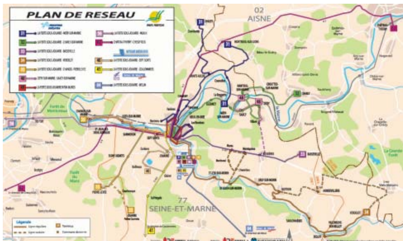
Plan du réseau de bus en Pays fertois

Aujourd'hui, le territoire dispose de 12 lignes régulières, 23 véhicules accomplissant 1 209 030 km annuels.