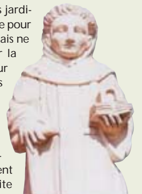
Statue de Saint-Fiacre

Il faut donc aller pousser la porte de l'église romane pour découvrir le patrimoine de la commune. Edifice roman, bâti au XII e siècle et dont les aménagements se sont poursuivis à l'époque gothique et au XVII e siècle, elle recèle la fameuse statue en pierre de Saint Fiacre, datant du XV e siècle et classée Monument Historique. Patron des jardiniers, Saint Fiacre était venu d'Ecosse pour évangéliser la Brie au VII e siècle. Mais ne manquez pas non plus d'admirer la belle facture des vitraux du chœur (1878) ni l'air espiègle des angelots qui décorent les chapiteaux des voûtes de la nef. Sur le talus latéral droit de l'église, lors d'installations de voirie, des squelettes du VIII e siècle ont été retrouvés. Leur positionnement atteste de l'emplacement d'un ancien cimetière et donc du site d'un ancien lieu de culte.