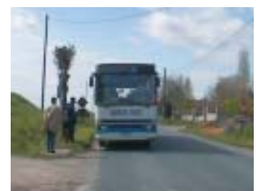
Arrêt Château d'Eau - Jouarre

2004, a également pour objectif d'harmoniser, sur l'ensemble du Pays fertois, ce que l'on appelle le « mobilier urbain », afin que ces arrêts de bus s'intègrent parfaitement dans le paysage rural de notre territoire, tout en respectant