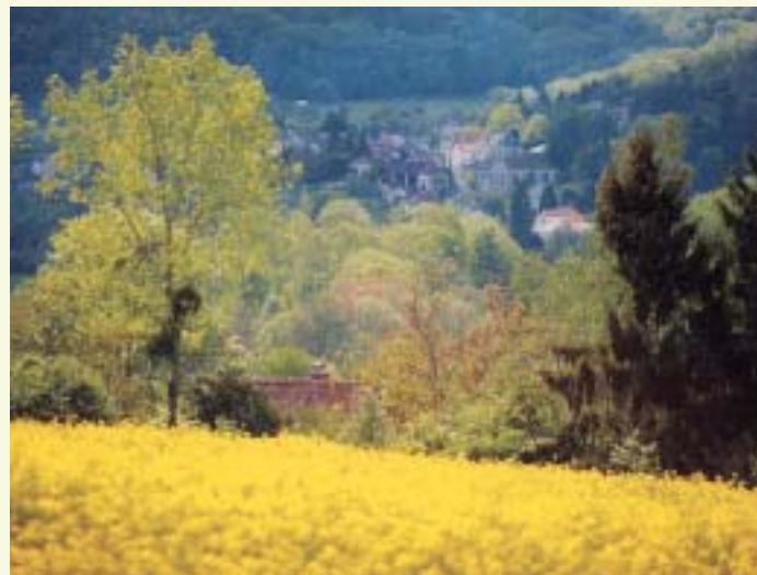
Le bourg de Sainte-Aulde, vu du hameau de Caumont

■ les 1 er et 3 e mardi de chaque mois, de 9 h 00 à 12 h 00 au CCAS de La Ferté-sous-Jouarre (Hôtel de Ville). Tél : 01.62.22.25.63.