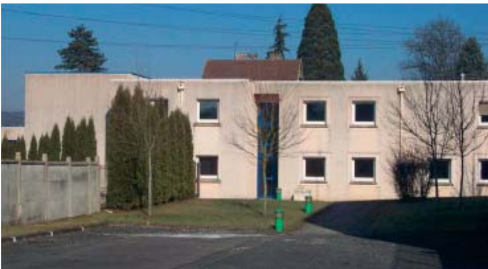
Le bâtiment de l'ancien centre EDF, rue de Reuil à la Ferté-sous-Jouarre, actuellement à l'étude.

■ 2004 sera aussi l'année de l'étude diagnostic sur la piscine intercommunale visant à restructurer et requalifier le bâtiment, avec notamment la perspective de couvrir le bassin extérieur (structure découvrable) en accroissant ainsi les possibilités d'accueil de la piscine pendant la période hivernale.