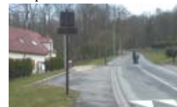
Arrêt Bois de Foy à Sept-Sorts

Lorsqu'ils existent, les abris bus - qu'ils soient en béton, en bois,