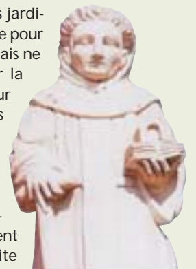
Statue de Saint-Fiacre

Il faut donc aller pousser la porte de l'église romane pour découvrir le patrimoine de la commune. Edifice roman, bâti au XII e siècle et dont les aménagements se sont poursuivis à l'époque gothique et au XVII e siècle, elle recèle la fameuse statue en pierre de Saint Fiacre, datant du XV e siècle et classée Monument Historique. Patron des jardiniers, Saint Fiacre était venu d'Ecosse pour évangéliser la Brie au VII e siècle. Mais ne manquez pas non plus d'admirer la belle facture des vitraux du chœur (1878) ni l'air espiègle des angelots qui décorent les chapiteaux des voûtes de la nef. Sur le talus latéral droit de l'église, lors d'installations de voirie, des squelettes du VIII e siècle ont été retrouvés. Leur positionnement atteste de l'emplacement d'un ancien cimetière et donc du site d'un ancien lieu de culte.