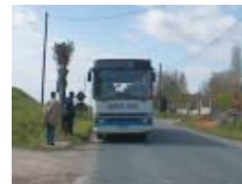
Arrêt Château d'Eau - Jouarre

114 abris-bus seront donc installés après d'importants travaux de voirie, dont une dizaine dits « Monuments Historiques », car traités différemment afin de respecter le périmètre de protection des bâtiments classés et de ne pas défigurer ces espaces. Tous ces abris bus seront équipés de bancs, poubelles et de panneaux d'affichage.