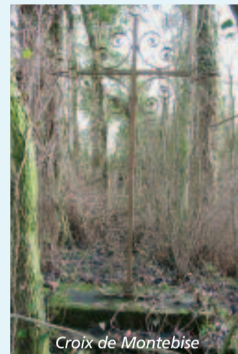
Croix de Montebise

Signy-Signets fut assez fidèle aux devoirs religieux, comme en témoignent les croix et calvaires disséminés sur le territoire de la commune comme autant de vecteurs territoriaux de l'histoire religieuse rurale. Signy-Signets en compte six, dont un