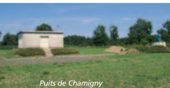
Puits de Chamigny

L'eau potable pour 14 communes du Pays fertois (à l'exception des communes de Bassevelle, Bussières, Signy-Signets, Saâcy-sur-Marne et Pierrelevée), provient du puits principal de Chamigny (qui couvre 88 % de la production), et des puits secondaires de Caumont-Sainte-Aulde (10%) et Méry-Luzancy (2%).