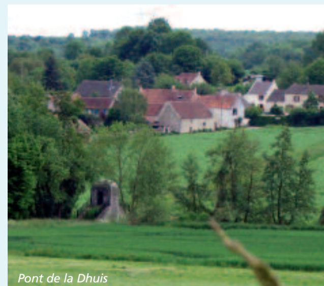
Pont de la Dhuis

Les 581 âmes que compte Signy-Signets se répartissent sur les 1343 hectares du village. Signy-Signets est traversé par le ru de la Jouvence, le ru de la Bécotte et la Dhuis qui lui a donné un charmant petit pont en meulière ; le pont de la Dhuis. Niché aux creux des champs, entre vallée et bosquets, Signy-Signets a su garder le charme de nos villages ruraux.