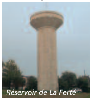
Réservoir de La Ferté

Toutes ces infrastructures (puits, vannes, canalisations et réservoirs) appartiennent à la Communauté de communes, et de ce fait, il lui incombe de veiller à son entretien et à son bon fonctionnement par le biais de la SAUR. Il est utile de préciser que le réseau public s'arrête au compteur d'eau. A partir de là, il appartient aux particuliers de veiller à l'entretien de leurs réseaux. Une directive européenne prévoit le remplacement des canalisations en plomb avant 2013. Tout le territoire est concerné, et un programme de renouvellement progressif a été conclu avec la SAUR, afin de réduire la teneur du plomb dans l'eau.