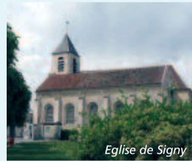
Eglise de Signy

Situé à l'est du territoire de notre communauté de communes, le village de Signy-Signets du latin « Signacum », d'où viennent les noms des habitants, les « signaciens et les signaciennes », proviendrait du propriétaire primitif « Gilbertus de Cigniaco » dont le nom est attesté en 1195 dans un Cartulaire (recueil d'acte de propriété) des Templiers de Provins. Signy-Signets était autrefois scindé en deux hameaux qui se sont divisés et rassemblés pendant près de 400 ans avant d'être définitivement regroupés par un décret en 1792. Signy, le plus grand des deux hameaux, se groupait autour d'une église et Signets, d'une chapelle. L'église de Signy fut détruite en 1824 et la chapelle de Signets, agrandie pour devenir la paroisse principale.