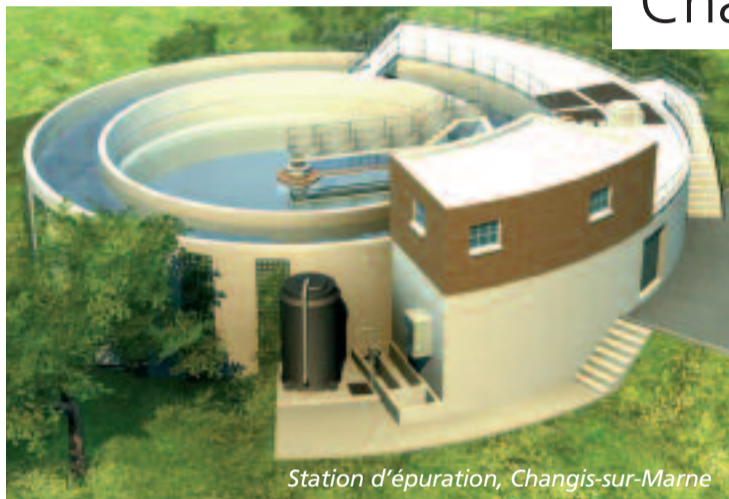
Station d'épuration, Changis-sur-Marne

Après plusieurs mois de procédures administratives complexes, le dossier d'autorisation a été déposé en préfecture. Une nouvelle station d'épuration conforme à la loi sur l'eau de 1992 devrait remplacer les deux anciennes de Saint-Jean-les-Deux-Jumeaux et Changis-sur-Marne, situées de chaque côté de la Marne. Cette nouvelle station, sera construite à Changis, pour un coût total de 1 600 000 euros, subventionné en grande partie par l'Agence de l'eau de Seine Normandie, le conseil général de Seine-et-Marne et l'Etat.