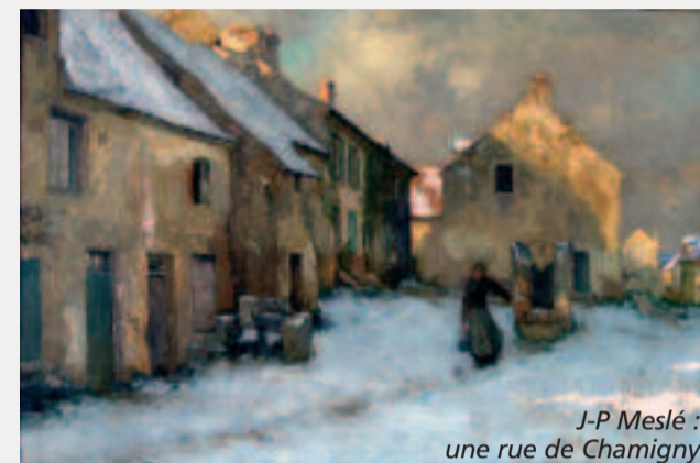
J-P Meslé : une rue de Chamigny

Une commune habitée autrefois par des hommes d'art qui lui donnèrent des œuvres lumineuses et empreintes d'une rare sensibilité. Il s'agit bien sûr des grands peintres, Fernand SABATE (1874-1940) et Joseph Paul MESLE (1855-1927) amis et artistes talentueux et qui élirent domicile dans le village.