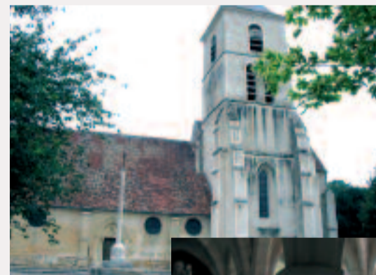
Eglise de Chamigny

L'église tout d'abord surplombe la rue principale et abrite une crypte du XIII e siècle très bien conservée et classée Monument Historique. Une tradition rapporte qu'avant d'être une chapelle, c'était une grotte païenne où une statue de la fée de la colline, la fée SIDEGOAH était vénérée. Puis, le