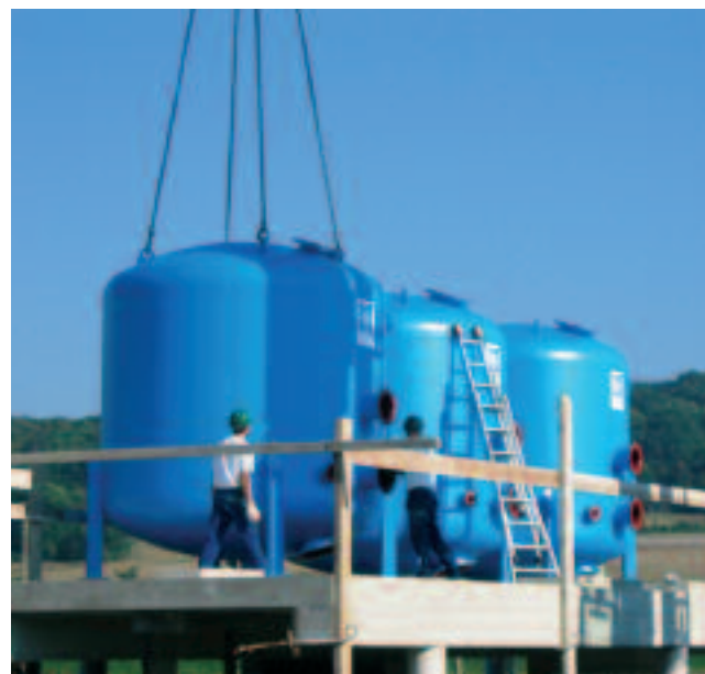
Construction de l'unité de traitement

La construction de l'unité de traitement pour l'eau potable est désormais terminée sur le site du puits de Chamigny. Après plusieurs phases de nettoyage des canalisations pour en retirer les dépôts de fer et de manganèse, l'usine de traitement devrait prendre le relais de façon complémentaire pour filtrer l'eau pompée au puits de Chamigny. La couleur marron observée à la sortie du robinet devrait peu à peu s'estomper.