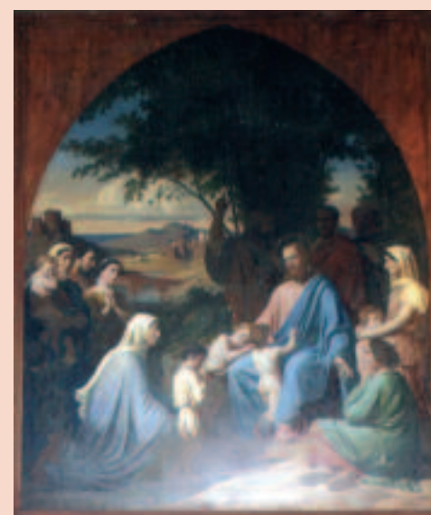
Tableau E. Lecomte

L'église, entièrement reconstruite en 1957 est dédiée à Saint Médard, le saint qui fait pleuvoir, symbolisé sur le blason du village par une larme. Elle renferme un tableau « Jésus Christ et les Petits Enfants » peint par Émile LECOMTE en 1850 et offert par M. SCRIBE à la paroisse. Un joli lavoir traditionnel en pierres meulières est adossé à l'église.