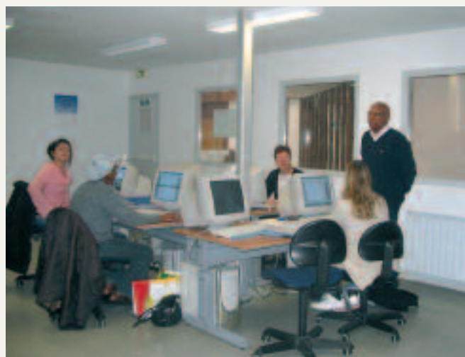
Le P@t de la Ferté-sous-Jouarre

Pour tout renseignement complémentaire, contacter M. Calixte au 01 60 09 06 21 ou l'ANPE de La Ferté-sous-Jouarre.