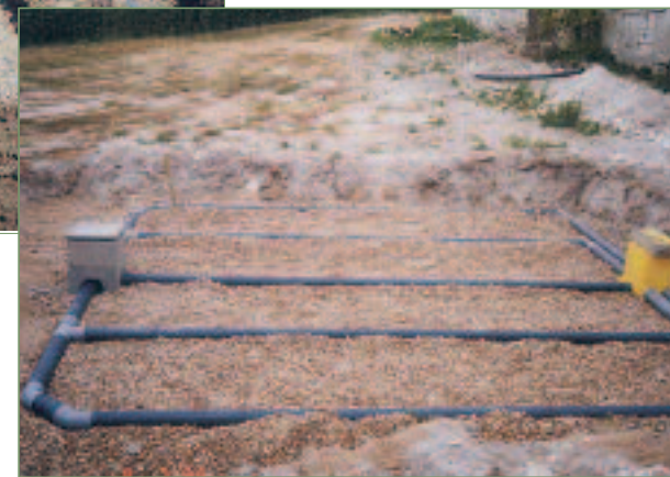
Filtre à sable vertical non drainé