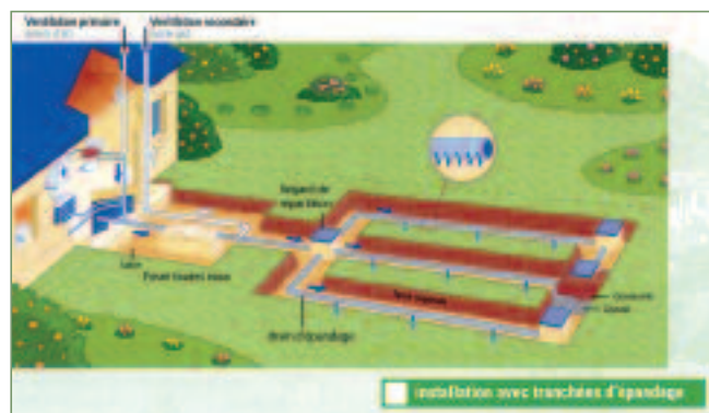
Mise en œuvre de « l'ANC »

Un arrêté du 3 mars 1982 régleme la construction et l'installation des fosses septiques avec comme grande nouveauté une obligation de traiter les eaux domestiques séparément des eaux vannes. Jusqu'en 1992, des questions sont soulevées concernant la prise en charge de l'entretien de ces installations, et la création potentielle d'un service public d'assainissement non collectif, un « SPANC ».