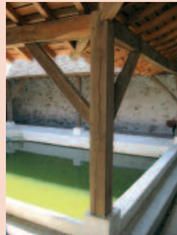
Lavoir de Bussièrès

Bussièrès est également connu pour le domaine de Sérécourt, qui dépendait comme fief, au XV e siècle, de la terre et seigneurie de Bussièrès.