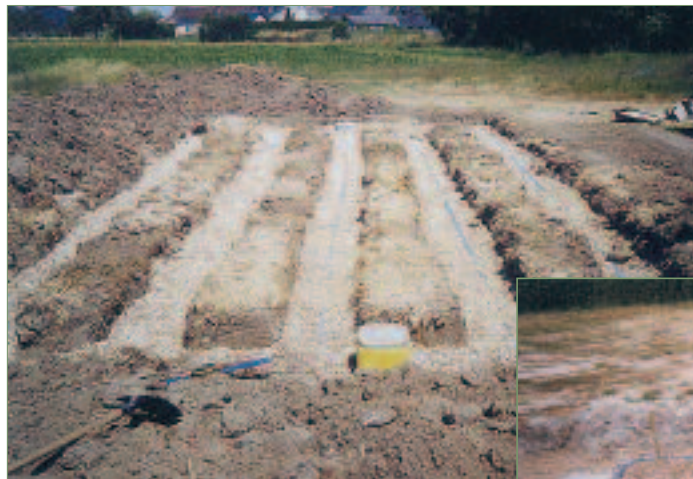
Tranchées d'infiltration à faible profondeur