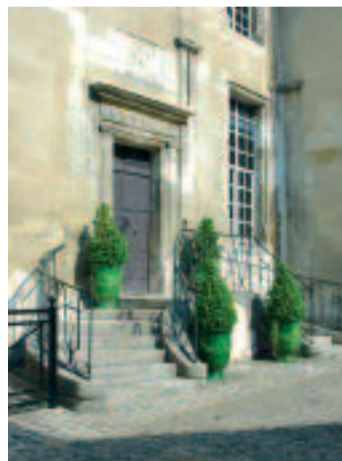
Musée Jean de la Fontaine

La collection s'articule autour de l'oeuvre du poète qui a inspiré les écrivains et les artistes du monde entier, associant le texte et l'image. Le musée propose une importante sélection d'éditions précieuses d'ouvrages de La Fontaine, ainsi que des objets d'art, des meubles, des sculptures, dessins, gravures, peintures d'artistes tels que JULIEN, OUDRY, FRAGONARD, VLEUGHELS, DECAMPS, LHERMITTE, DAUBIGNY, CHAGALL..., des miniatures chinoises, japonaises, indiennes, persanes (collection du Baron Feuillet de Conches, XIX e ). Toutes ces oeuvres sensibilisent le visiteur à la qualité et à la complexité de cet illustre écrivain de la culture française et francophone à travers le temps.