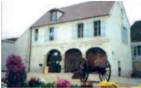
Musée civilisation paysanne

Ne manquez surtout pas un passage au Musée de la civilisation paysanne, anciennement musée briard, fondé il y a plus de quarante années par les Amis des Arts et Traditions de la Brie. L'histoire des savoir-faire briards est présentée dans les locaux de l'actuel office de tourisme de Jouarre. Une collection d'objets datant du XVI e au XVIII e siècle résume admirablement les traditions de notre région : fabrication du fromage de Brie, maréchalerie, meulerie, travail de la terre.