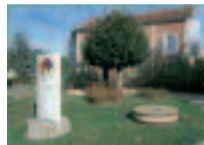
Musée pays de Seine-et-Marne

Ce musée d'ethnographie présente depuis son ouverture en 1995 des témoignages matériels de la société traditionnelle du nord-est de la Seine-et-Marne, ainsi que des collections municipales évoquant Pierre Mac Orlan (1882-1970), écrivain du "fantastique social", qui vécut pendant une quarantaine d'années à Saint-Cyr-sur-Morin.