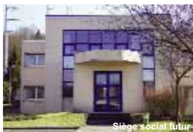
Siège social futur

Le Pays Fertois Journal de la Communauté de communes du Pays fertois 22 avenue de Rebais - 77260 La Ferté-sous-Jouarre info@cc-paysfertois.fr Tél. 01 60 22 10 92 - Fax 01 60 22 95 96