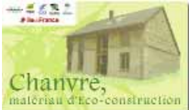
Panneau visible sur les parcelles de chanvre

Le projet d'éco-vallée de la Marne vise à créer des activités économiques et des emplois dans le domaine de l'éco-bâtiment. La création d'une filière agricole de matériaux naturels pour le bâtiment et des savoirs-faire écologiques au service des entreprises de construction est la première étape. Soutenu par le département et la Région, la Chambre d'agriculture et la Fédération du bâtiment ainsi que l'ARENE (agence Régionale pour l'environnement et les nouvelles énergies), des agriculteurs, des entreprises et des architectes de notre canton, ce projet commence à se concrétiser avec la première récolte et transformation de chanvre en 2008, la mise en place d'un démonstrateur en partenariat avec le CFA du bâtiment d'Ocquerre et des formations adaptées.