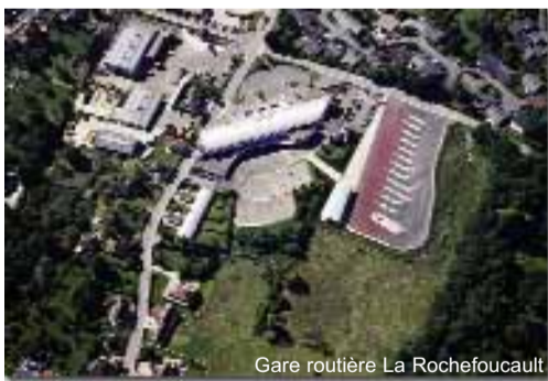
Gare routière La Rochefoucault

L'ouverture du lycée, l'an dernier, a accueilli les classes de seconde. La deuxième année d'exis-