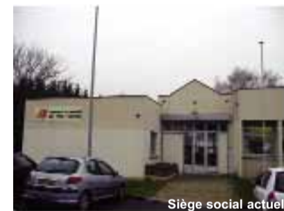
Siège social actuel