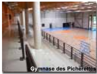
Gymnase des Picherettes

● Toujours à Saâcy-sur-Marne, l'étude d'une structure couverte devant permettre la pratique des arts martiaux est en cours de finalisation dans les services techniques de la Communauté de communes