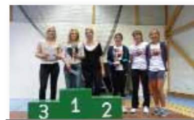
Classement équipes féminines