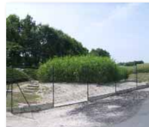
Station d'Arpentigny (St-Jean-les-deux-Jumeaux)