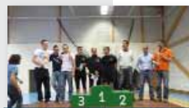
Classement équipes masculines