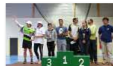
Classement équipes mixtes